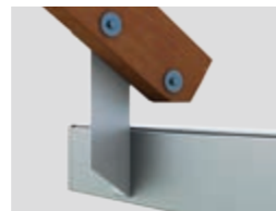
Dachsparrenmontage (bei überstehendem Dach)