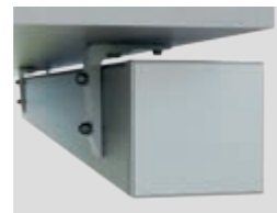
Deckenmontage (auf und unter dem Dach)

Neben der herkömmlichen Wandmontage lässt sich Kubata auch bei besonderen baulichen Voraussetzungen problemlos anbringen.