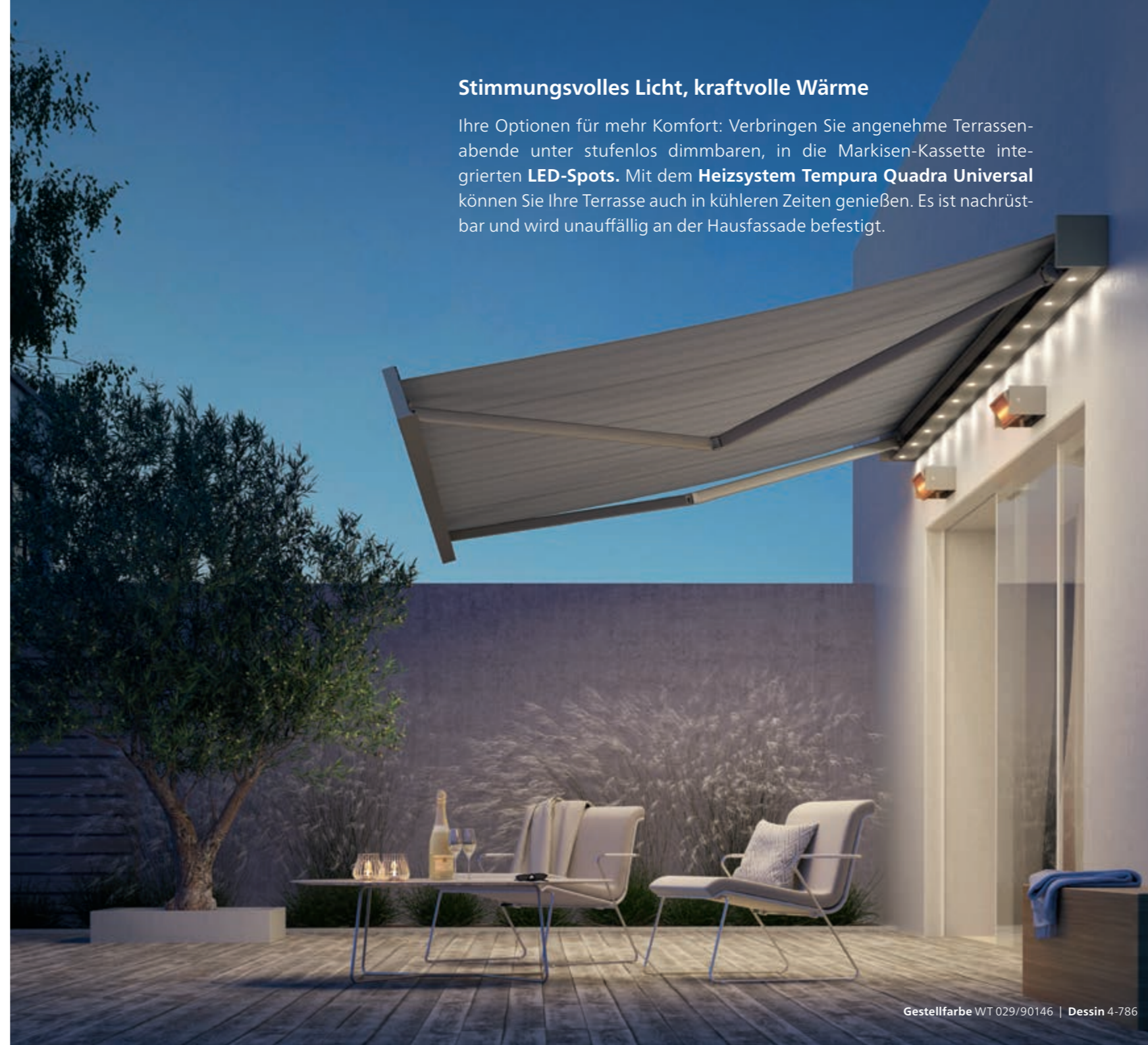
Gestellfarbe WT 029/90146 | Dessin 4-786

Ihre Optionen für mehr Komfort: Verbringen Sie angenehme Terrassenabende unter stufenlos dimmbaren, in die Markisen-Kassette integrierten LED-Spots . Mit dem Heizsystem Tempura Quadra Universal können Sie Ihre Terrasse auch in kühleren Zeiten genießen. Es ist nachrüstbar und wird unauffällig an der Hausfassade befestigt.