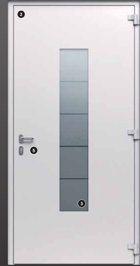
Innen: FS 9016