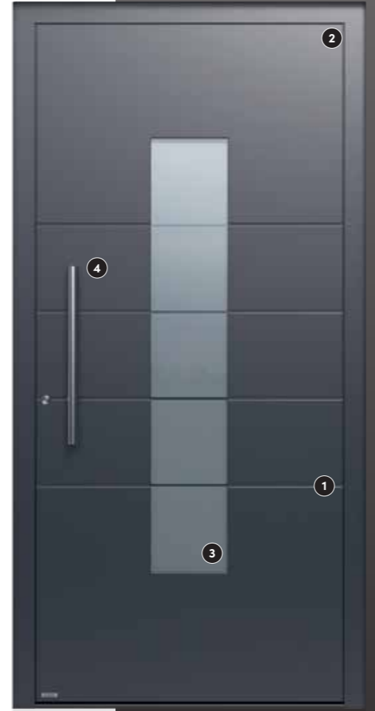
Außen: FS 7016